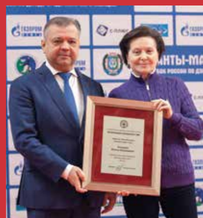
Губернатор Ханты-Мансийского автономного округа – Югры Наталья КОМАРОВА

Федерация дзюдо России, Федерация дзюдо Югры, АУ «ЮграМегаСпорт» – совместные усилия трех авторитетных организаций создали настоящий праздник дзюдо. Создали так, что во время финального дня состязаний поступило предложение провести в ближайшие годы турнир «Большой шлем» в Ханты-Мансийске. Безусловно, этот факт подтверждает силу югорского дзюдо и профессиональное умение проводить масштабные состязания всероссийского и мирового уровня. «Несколько лет назад мы здесь проводили Чемпионат России. Поэтому в плане качественной организации