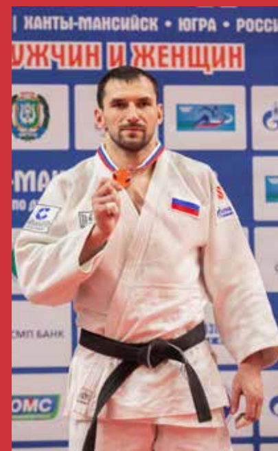
Дмитрий ДОВГАНЬ – победитель Кубка России по дзюдо

Кубок России открыл новую страницу в истории спортивных успехов автономного округа. Югра закрепила свои высокие позиции на карте дзюдо России. И это наша общая победа.